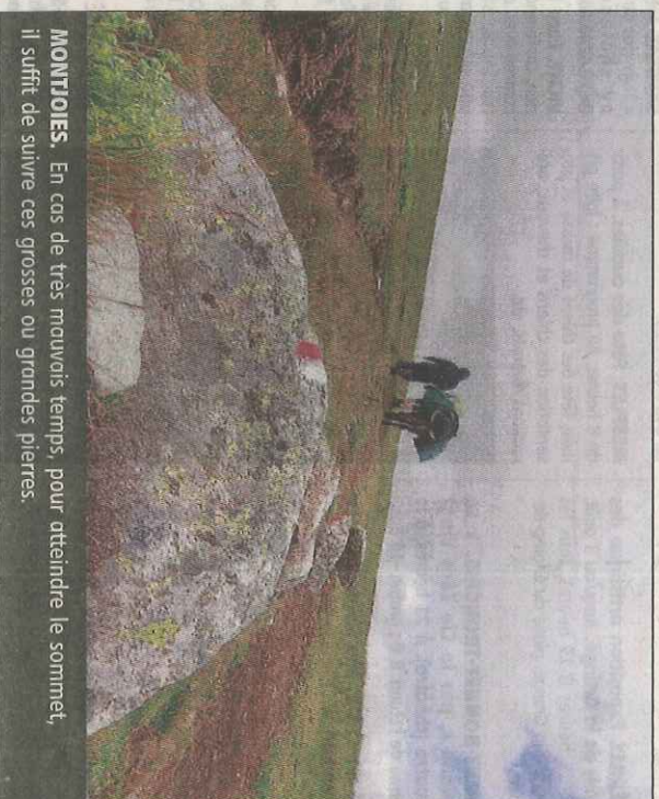
MONTIONIES. En cas de très mauvais temps, pour atteindre le sommet, il suffit de suivre ces grosses ou grandes pierres.