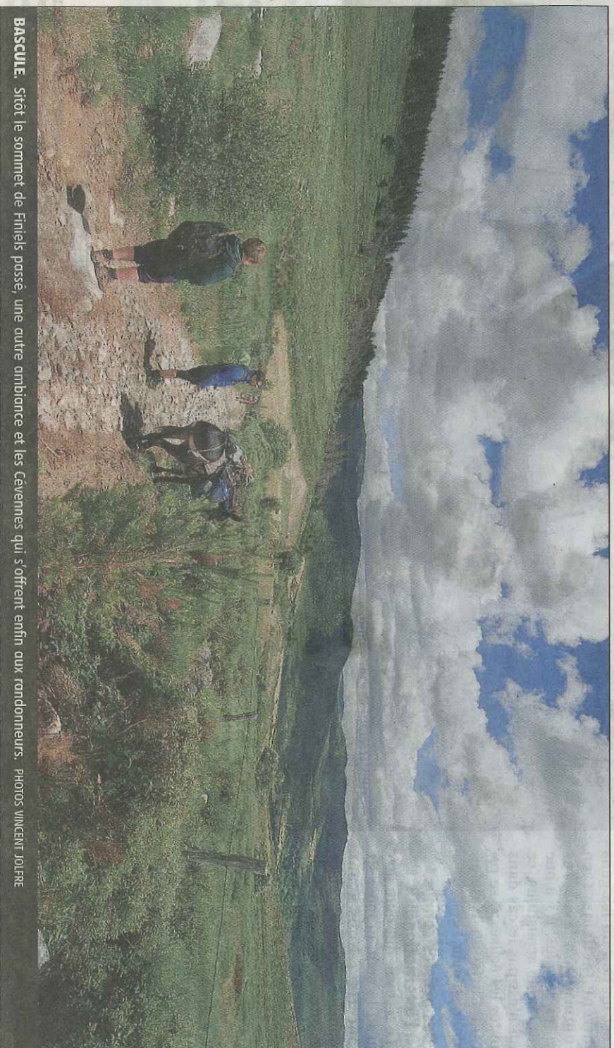
BASCULE. Stotôt le sommet de Finiels posé, une autre ambiance et les Cévennes qui s'offrent enfin aux randonneurs.

Au Bleynard, nous profitons d'un peu de vie. On répond volontiers aux bonjours des habitants sous le charme de Black : la saison des ânes, celle des familles en vacances, débute à peine et les animaux ne font pas encore partie du décor... Ça fait déjà longtemps que nous sommes, auprès des autres randonneurs, « les trois messieurs avec l'âne ». On nous appelle de loin, on nous photographie - il semblerait que ce plébiscite n'ait aucun lien avec le rebondi gracieux de nos mollets... La tête a peut-être gonflé et, pris