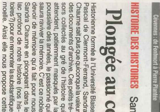
Cévennes : de Fontmorêt à Pierre Plantée

Puis il emprunte la vallée de la Mimente. La fin de son voyage approche. Il se réveille avec le chant des coqs au milieu des châtaigniers de Saint-Germain-de-Calberte. C'est ici justement qu'est enterré Chayla, dans ce petit îlot catholique en terre protestante. « Un homme a toujours tort de changer » semble être pour Stevenson la philosophie de la Lozère. Là un catholique le lui dit en évoquant un coréligionnaire s'étant converti au protestantisme par amour, mais c'est une maxime qu'il a entendue à d'autres reprises durant son voyage, aussi bien en pays catholique qu'en pays protestant. Il part le long du Gardon, traverse Val Francaesque, dîne au sommet de la montagne Saint-Pierre, avant de redescendre vers Saint-Jean-Du-Gard. Le lendemain matin, le verdict tombe : Modestine, épuisée, les pattes blessées, doit avoir deux jours de repos. Il décide de la vendre et de stopper là son voyage dans les Cévennes.