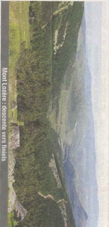
Mont Lozère : descente vers Finiels