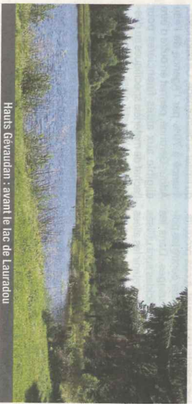
Hauts Gévaudan : avant le lac de Lauradou

Il décide de partir du Monastier, en Haute-Loire, après y être resté un mois pour écrire. Il ira jusqu'aux Cévennes, car Écossais protestant, il veut passer par les paysages qui ont abrité la révolte des Camisards qui fait écho chez lui à celle des « Covenantiers » de son pays. Au cours de son périple, il prend des notes afin de rédiger son ouvrage. Si vous êtes fâché avec les auteurs du XIX e trop académiques, jetez-vous sur celui-ci. On y trouve une grande liberté de ton. Il évoque par exemple sans ambages les querelles politiques, les médisances, et l'amour pour la « dive bouteille » du Monastier.