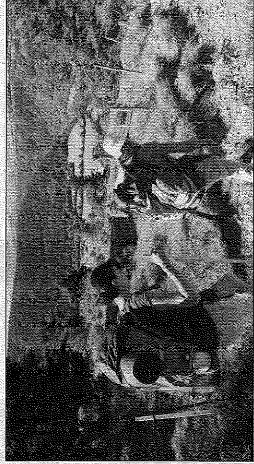
Deux marcheurs sur le Stevenson à Goudet.

Mais, contrairement à l'auteur du livre, 90% des randonneurs sont à pied et sans